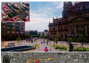
Figura 06. Cazares Quintero, V. D. (2019). Cruz de Plazas. (imagen aérea tomada de internet).

Sin embargo, parte de estas edificaciones se perdieron un siglo después con los procesos de modernización urbana por los que pasa la ciudad, ya que es éste eje norte-sur una de las vialidades en la cual se verán reflejados los pensamientos urbanos durante el siglo XX, y es en la cual a partir de mediados de siglo se efectuarán las mayores transformaciones dentro del centro histórico.