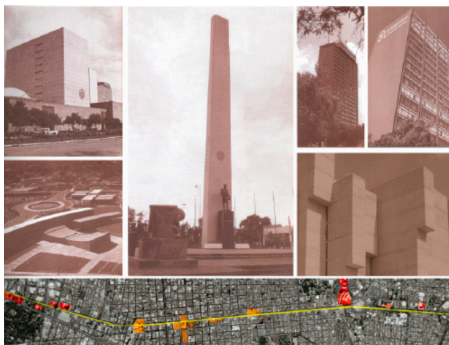
Figura 09. C Arquitectura siglo XX, imágenes tomadas del libro Jalisco 100 años de arquitectura, edición por el autor.

Se tiene por tanto que es en el siglo XX cuando se realizan la mayor transformación de la Av. Alcalde-16 de septiembre, impactando en la sociedad y en la manera en que se ve el centro histórico. Aparecen en los extremos muestras de arquitectura moderna como: El condominio Guadalajara, el Hotel Hilton, la Biblioteca Pública del Estado de Jalisco y la plaza Juárez hacia el sur; el CUCSH, el Archivo del Estado de Jalisco, teatro Experimental, etc., hacia el norte. (ver figura 09).