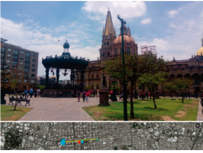
Figura 03. Plaza de Armas

En el costado sur de la Catedral se localiza la Plaza Mayor o Plaza de Armas de la urbe fundada durante el siglo XVI ( ver figura 03) característica de las fundaciones españolas y en la cual desde su nacimiento se realizan los festejos y actividades políticas de mayor relevancia para la ciudad, Dolores Damián comenta que: