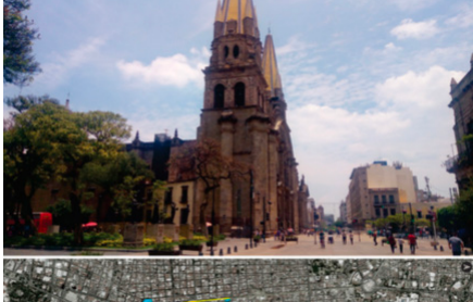
Figura 02. Cazares Quintero, V.D. (2019) Catedral de Guadalajara

Apartir del punto central se genera en la traza de la ciudad lo que López moreno 7 llama Cruz Urbana, enmarcada por el convento de San Francisco al sur, el templo Santo Domingo al norte, el convento de el Carmen al poniente y el templi de San Juan de Dios al oriente, teniendo al centro la concentración de los poderes religiosos, políticos y la plaza principal ( ver figura 01), siendo estos elementos los más representativos e importantes para la configuración de la ciudad en los primeros siglos a partir de su fundación, los edificios, vestigios y restos de algunos de estos inmuebles son los que conforman el actual patrimonio del eje.