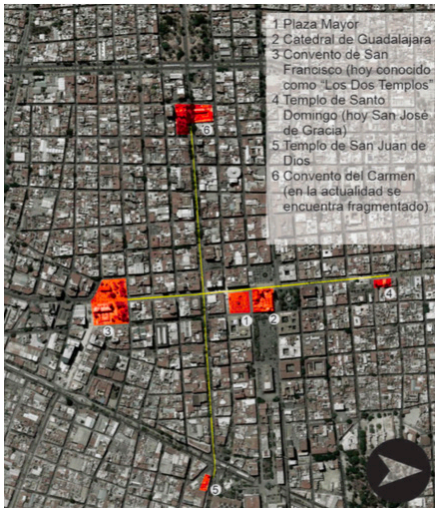
Figura 1. Cazares Quintero, V.D. ( s.f.). Cruz Urbana basada en “ La Cuadrícula “ de Eduardo López Moreno