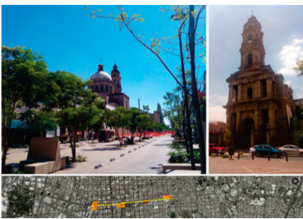
Figura 06. Cazares Quintero, Victor Daniel. (2019). San José.

Durante el siglo XIX se generaron una serie de cambios que van a influir en la arquitectura dentro del eje vial. A inicio de siglo se comienza con la construcción del Sagrario Metropolitano ( ver figura 06), iglesia construida a un costado de la Catedral y en la cual intervendrán algunos de los arquitectos más reconocidos del momento como José Gutiérrez que inicia con el proyecto por encargo del obispo Cabañas, Manuel Gómez Ibarra concluye la edificación después de años de detenida la obra y Antonio Arroniz 10 que interviene la cúpula después de que ésta sufriera daños a finales de siglo, el Sagrario presenta un estilo neoclásico y se convierte en parte de la imagen urbana y complemento de la Catedral de Guadalajara en su función de punto central y de reunión para la ciudad.