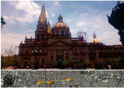
Figura 05. Sagrario Metropolitano