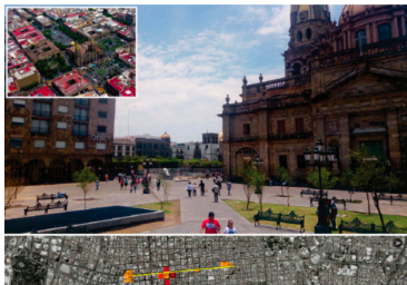
Figura 06. Cazares Quintero, V. D. (2019). Cruz de Plazas. (imagen aérea tomada de internet).

Sin embargo, parte de estas edificaciones se perdieron un siglo después con los procesos de modernización urbana por los que pasa la ciudad, ya que es éste eje norte-sur una de las vialidades en la cual se verán reflejados los pensamientos urbanos durante el siglo XX, y es en la cual a partir de mediados de siglo se efectuarán las mayores transformaciones dentro del centro histórico.